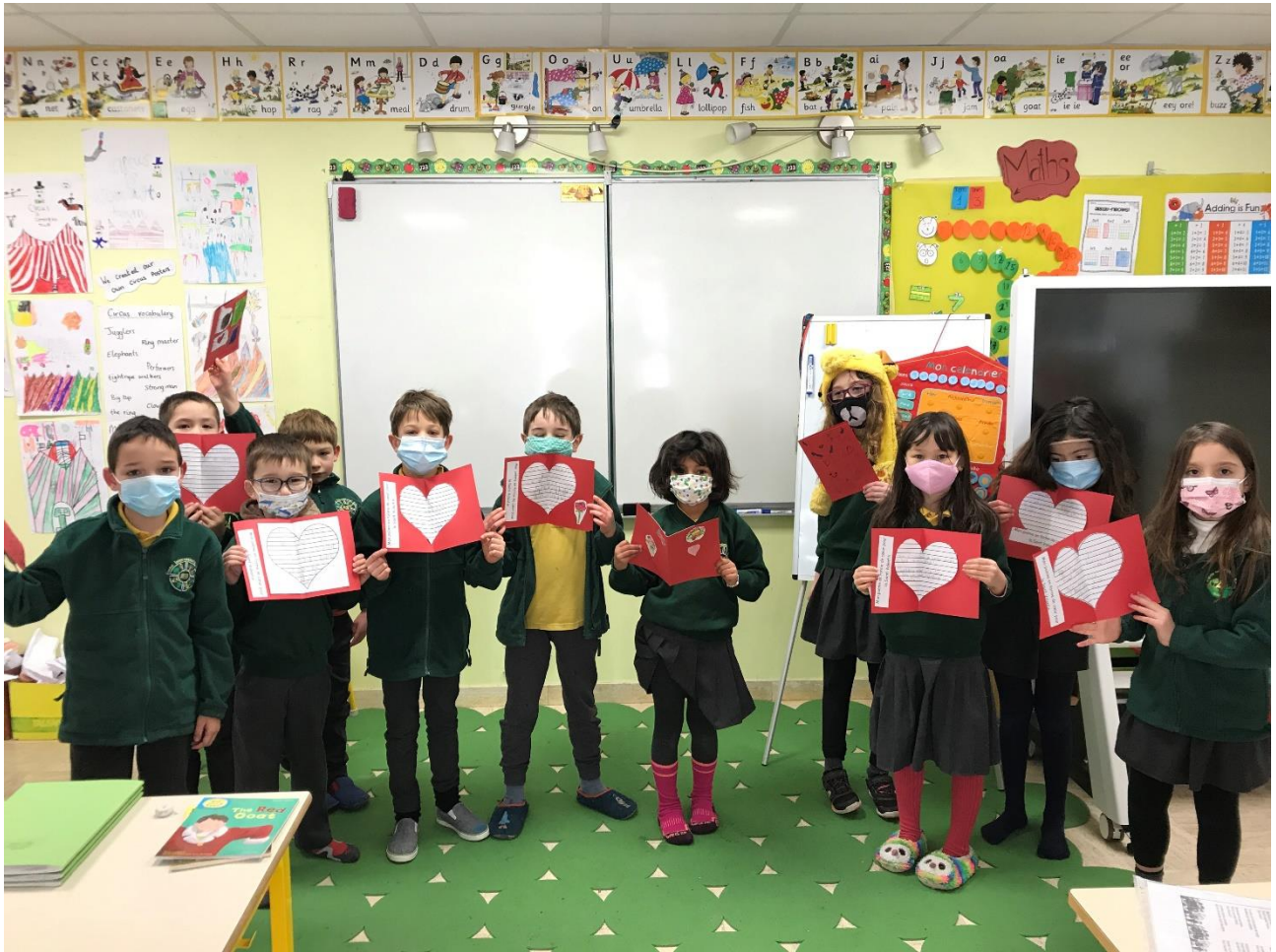
Carte de St Valentin pour les parents