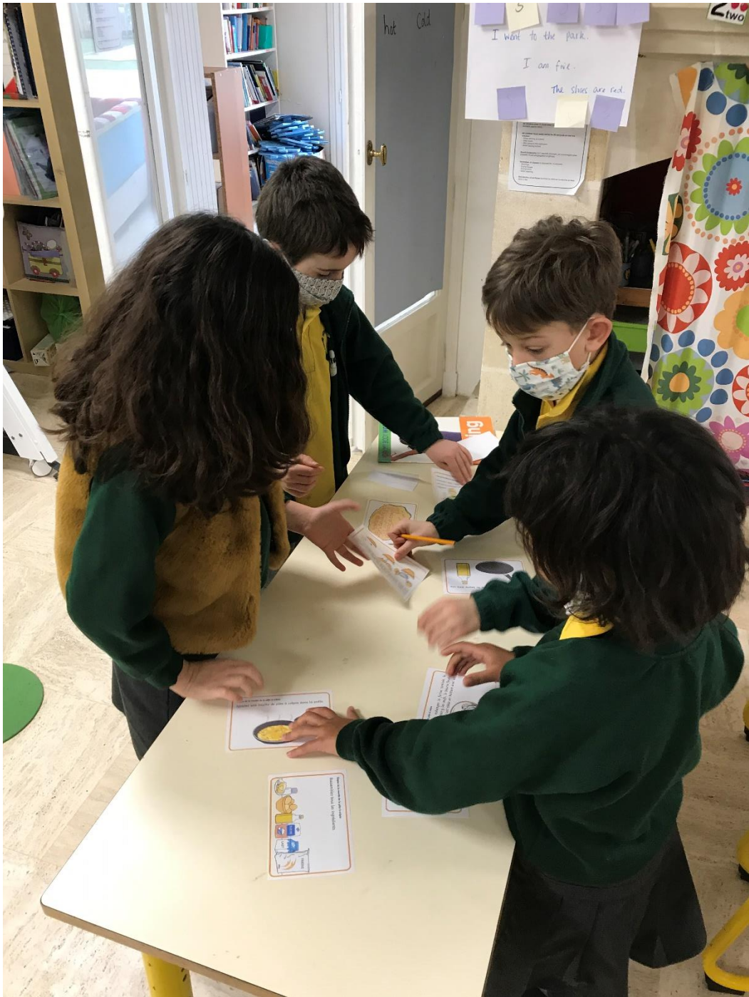
Remettre en ordre les étapes de préparation des crêpes pour la Chandeleur